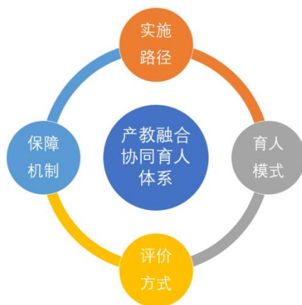
图 2 产教融合协同育人体系模式图

实施路径主要包括创新农林高校产教融合协同育人模式（政府引导，保障育人；校所协同，驱动育人；行业监督，规范育人；企业对接，协同育人）、构建多元化综合性实践教学平台、发挥农林高校专业群作用、探索农林高校专业群运行机制、构建农林高校学科群课程教学标准、农林高校与合作企业联合培养实践型师资队伍、农林高校与合作企业联合建设产业化教学资源、构建农林高校专业群课程质量评价体系。在育人模式方面，面向乡村振兴和新农科建设，重构专业人才培养模式（创新人才培养模式、构建课程教学体系、构建全新的实践教学体系、完善产教融合协同育人的人才培养方案）、修订专业课程标准、构建“课内外互补、学实赛创、校企合作”教学模式、建立专业核心课程群、创建多维度教学方法和构建产教融合协同育人的评价机制。在评价方式方面，坚持质量标准与需求导向相结合、实践教学与协同育人相结合、专业教育与思政教育相结合、创新创业教育与专业教育相结合基本原则，明确立德树人根本任务，学校出台各项产教融合管理制度。对学生的考核，引入企业考核标准和创新创业内容，注重过程性考核，结合学生在课程教学中参与技能竞赛的表现进行综合考核，从综合实践评价、企业导师评价、团队合作评价等方面进行。